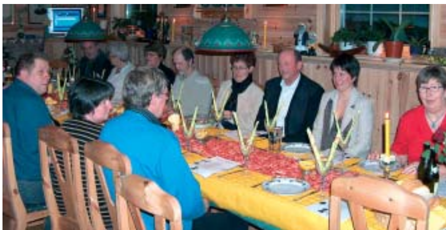
Noen av deltakerne på Rekefesten fredag 18. mars 2005. i Nodevig

Det er god oppslutning om aktivitetene i laget. Over tretti medlemmer på møtene er bra (Det er 65 medlemmer i laget). A.L.F. Vest-Agder har plass til enda flere på møtene og aktivitetene våre. Det er ikke noe som er så trivelig som og må finne frem flere kopper og hente inn flere stoler. Det er alltid plass til en person til.